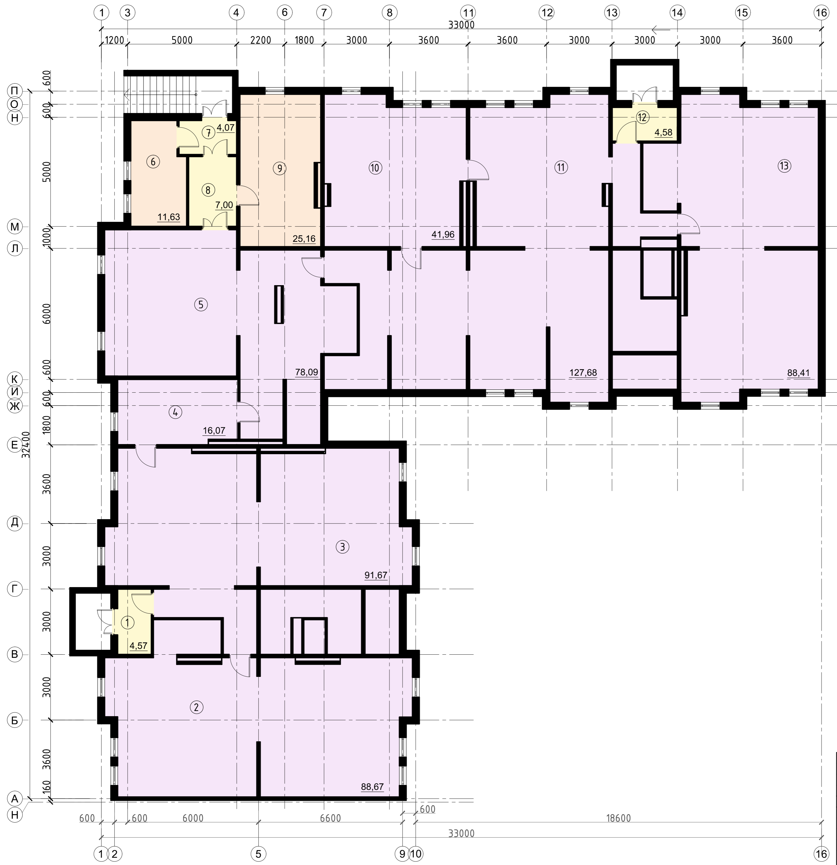
КОРПУС 2 ПЛАН ПОДВАЛА